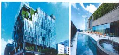
都 ホテル 博 多